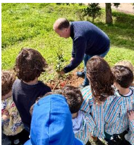
Dia Mundial da Árvore