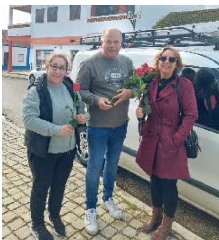
Dia da Mulher