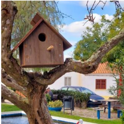
Ninhos no Jardim Central