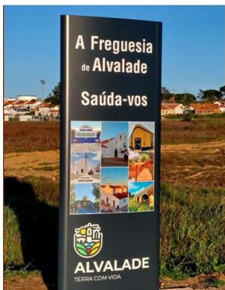
Colocação de totem identificativo da localidade