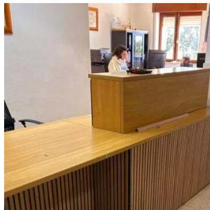
Novo balcão de atendimento