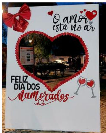
Dia dos Namorados