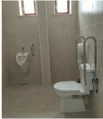
Trabalhos de modificação dos WC's