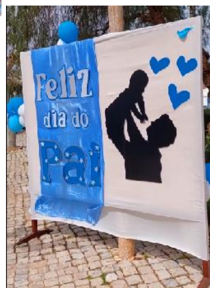
Dia do Pai