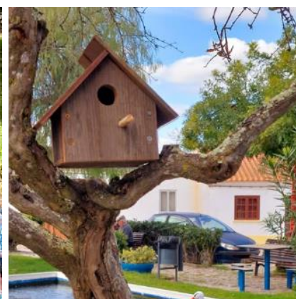
Colocação de Ninhos