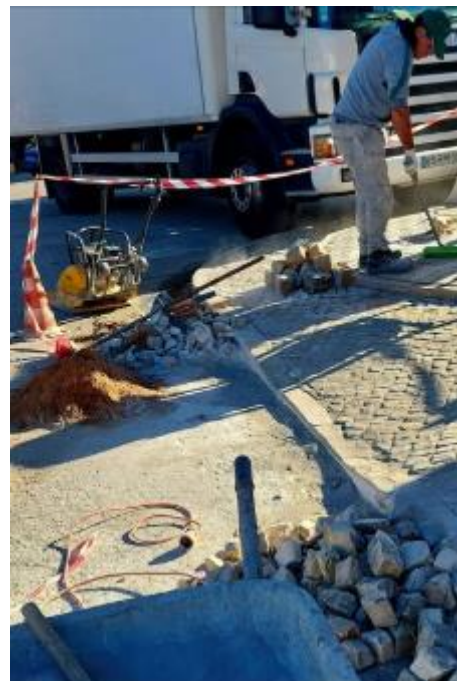
Criação de rampas de acesso para pessoas com mobilidade reduzida em diversos locais da freguesia