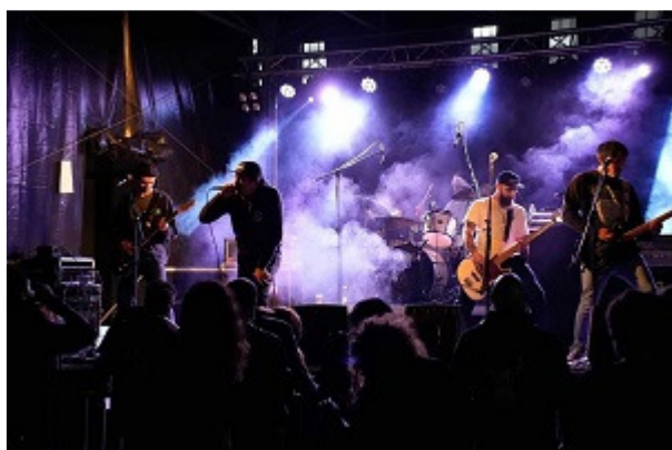
Alvalade Arise 2024