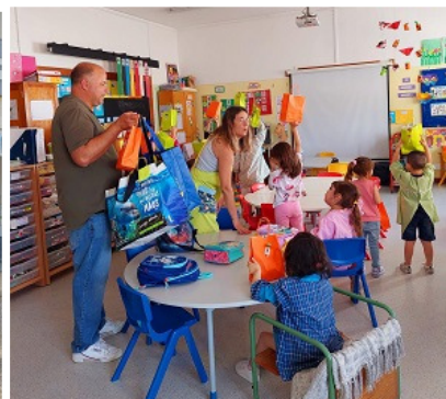
Entrega de prendas às crianças da freguesia