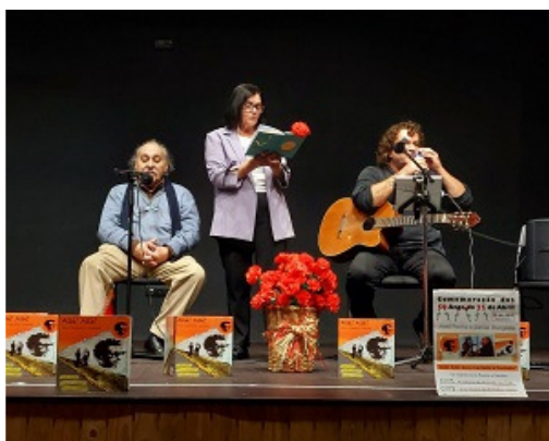
(AILÉ AILÉ... Zeca cantado e contado) (AMA)