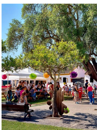
Dia da Criança