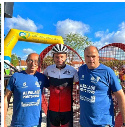
BTT Alvaladense 2024