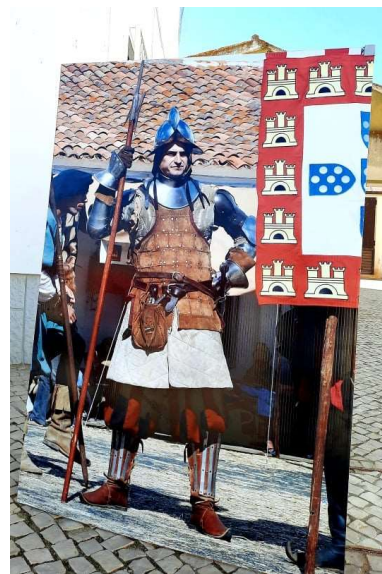
Exposição - Foral