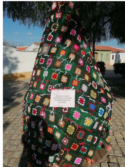
Trabalho das Bordadeiras