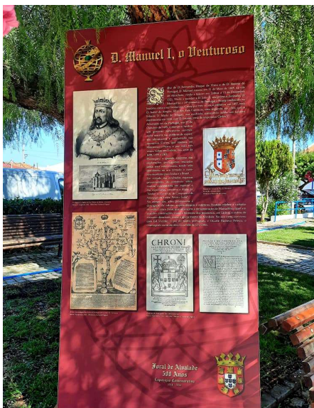
Exposição - Foral