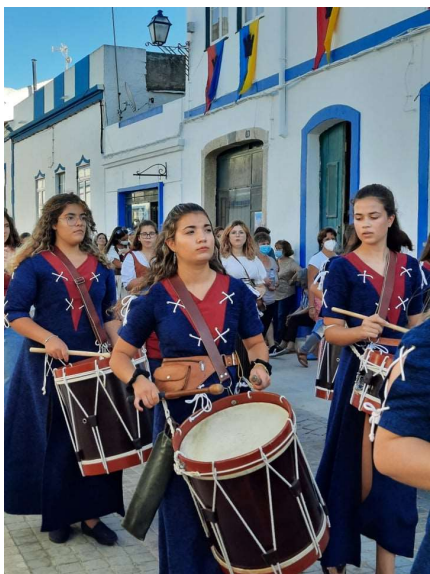
Arruada - Foral