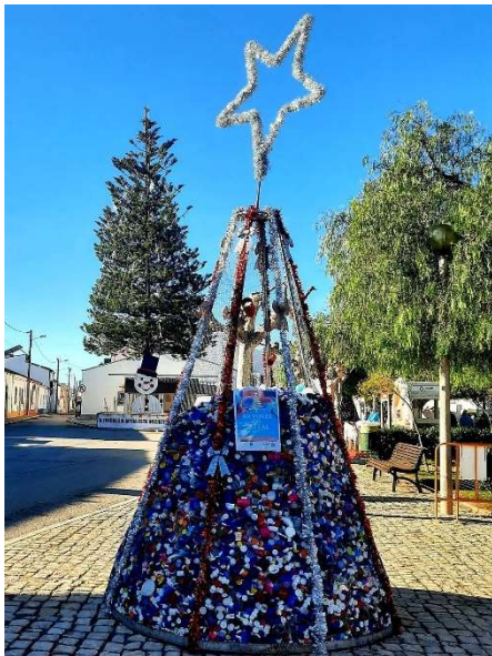
Árvores de Natal Solidárias