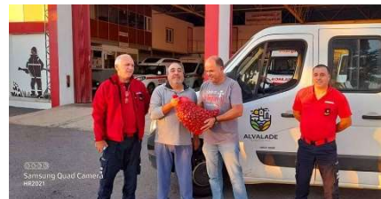
Oferta de Castanhas