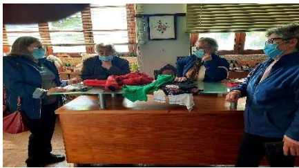
Loja Social - Reabertura