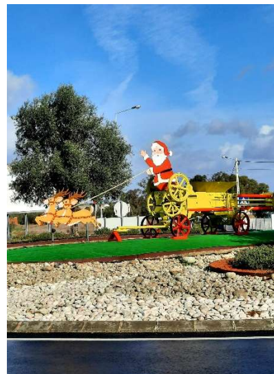
Decorações de Natal