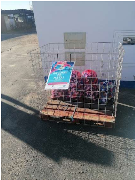
Árvores de Natal Solidárias